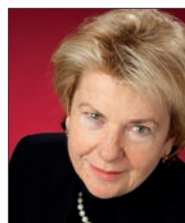
Waltraud Klasnic President of Hospice Austria